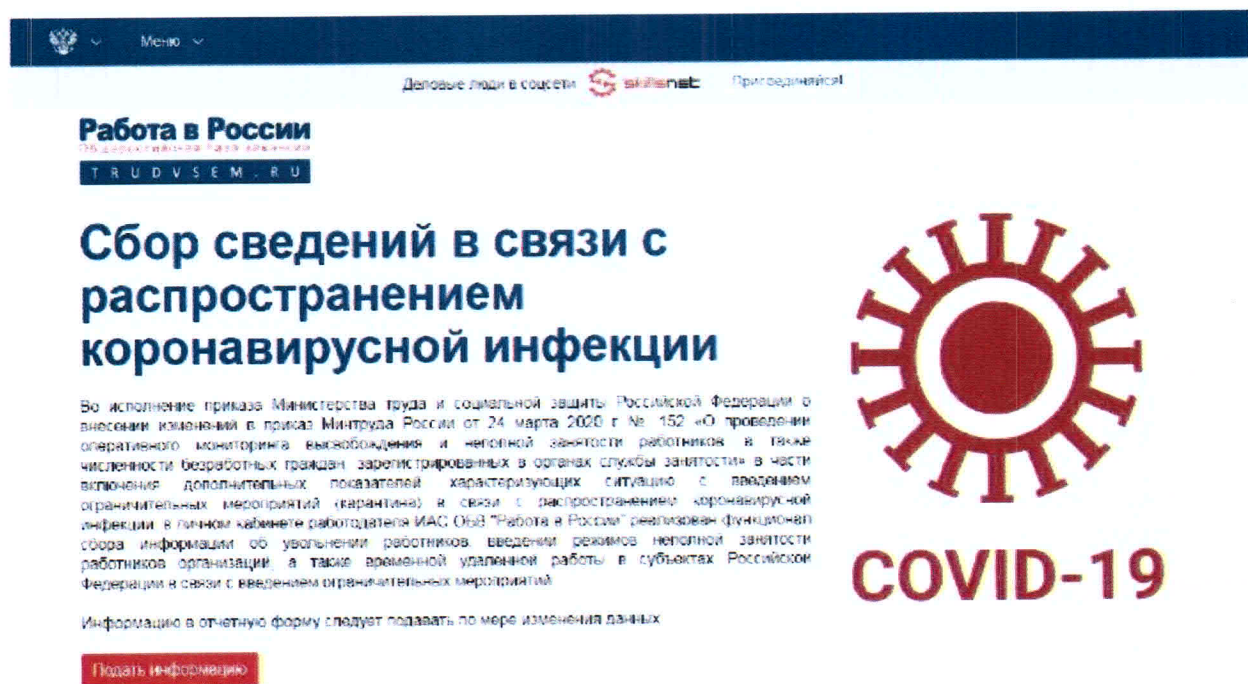
Рис. 2. Информационная страница